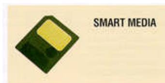
Bild Speicher auf "SMART MEDIA" -Karte

WonderTrack gibt auf allen Bildern die Nummer der Kamera, Datum und Uhrzeit, sowie die Art des Alarms an, um Nachforschungen zu erleichtern.